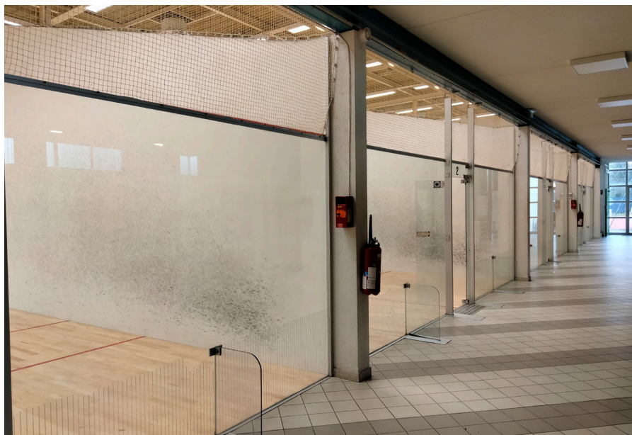
Courts de squash