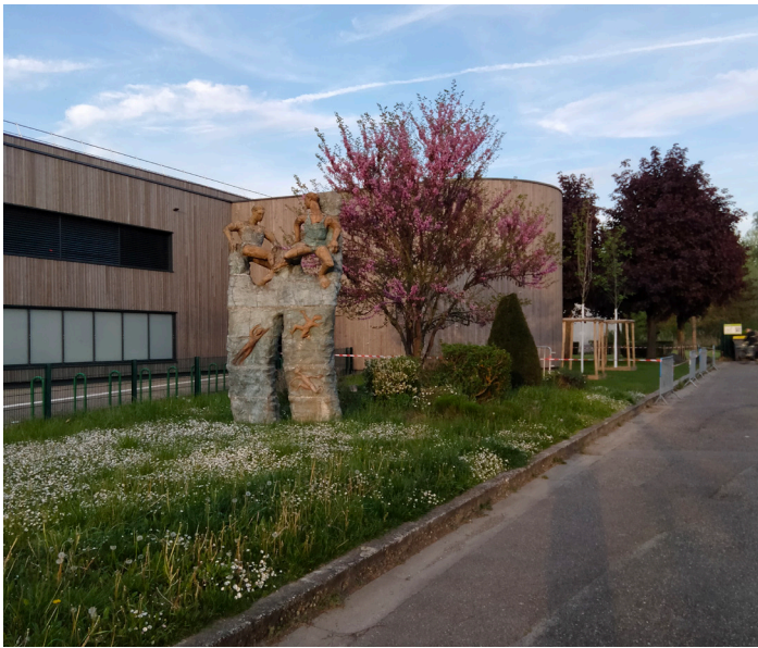
Entrée gymnase principal