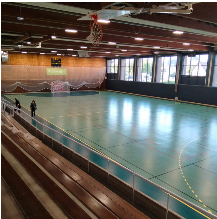
Gymnase pour le tennis de table et le badminton