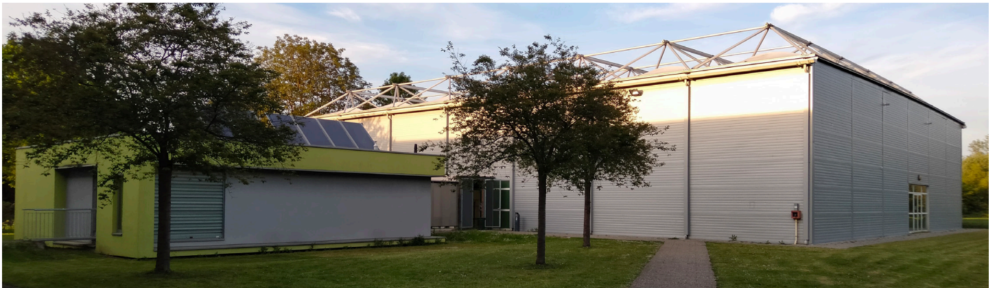
Accès salle permanente badminton

Pour terminer, une salle spécifique dédiée au badminton accueille les terrains d'échauffement pour le tennis de table et le badminton. Trois terrains de badminton sont conservés en terrains d'échauffement, trois tables de tennis de table seront installées sur les deux terrains restants.