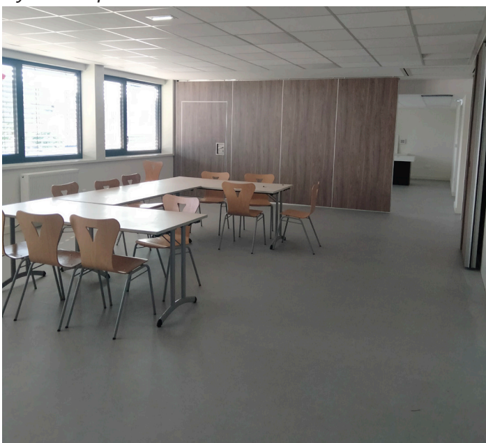
Club house - buvette