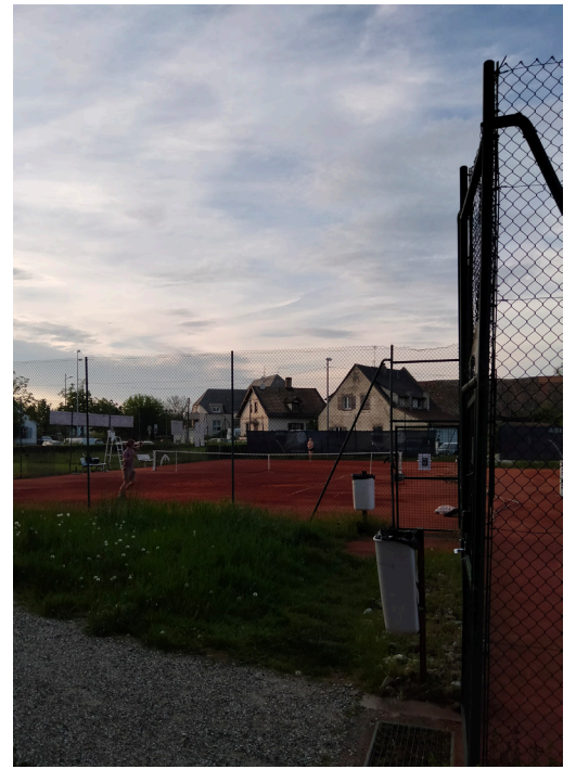
Terrains de tennis extérieurs

Pour terminer, une salle spécifique dédiée au badminton accueille les terrains d'échauffement pour le tennis de table et le badminton. Trois terrains de badminton sont conservés en terrains d'échauffement, trois tables de tennis de table seront installées sur les deux terrains restants.